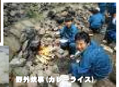
野外炊事(カレーライス)