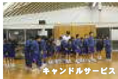
キャンドルサービス