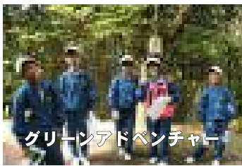
グリーンアドベンチャー