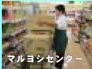
マルヨシセンター

9月6日(火)～8日(木)の3日間、小豆島内外の様々な事業所で職場体験学習を行いました。学校では体験することのできない経験をすることができ、将来に向けて考える機会になりました。