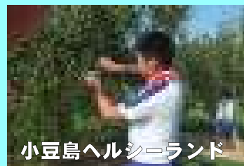
小豆島ヘルシーランド